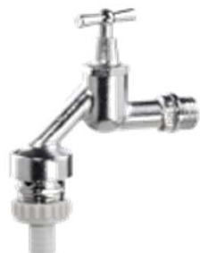
Auslaufventil matt verchromt mit Rohrbelüfter mit stopfbuchslosem Oberteil mit DVGW-Zulassung Nr. 2200