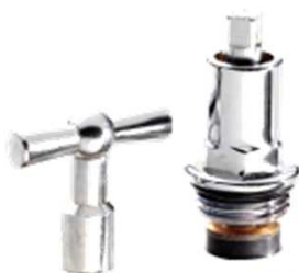
Steckschlüsseloberteil für Auslaufventile matt verchromt mit Steckschlüssel Nr. 2160