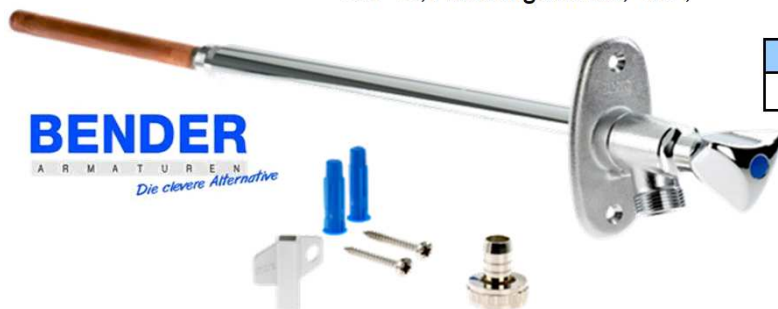
Frostsicheres Außenwandventil MONTI-Fix II mit Belüfter, RV, SVS, mit Steckschlüssel und Haubengriff, für Wandstärke bis 300 mm, Messing, verchromt, DN 15, Aussengewinde, 1/2",