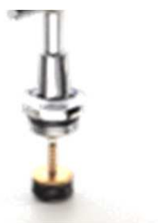
Oberteil für Auslaufventil matt verchromt stopfbuchslos Nr. 2155