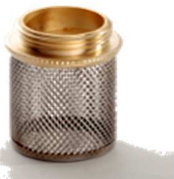
Saugkorb für Rückschlagventil