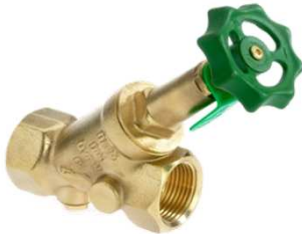
Absperrbarer Rückflußverhinderer (KFR) mit Kontrollstutzen und steigendem Oberteil DIN DVGW zertifiziert