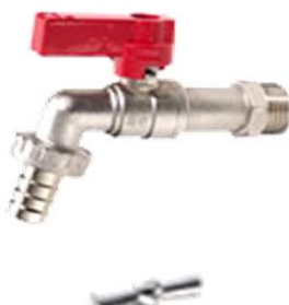
Kugelauslaufventil mit Schlauchverschraubung matt verchromt arretierbar Griff rot Nr. 2300