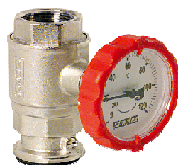
Pumpenkugelhahn PN 16 S mit integrierter Schwerkraftbremse (arbeitet nicht als Rückschlag- klappe) und Aufstellvorrichtung für druckseitigen Anschluss an Umwälzpumpe, voller Durchgang für horizontalen und vertikalen Einbau mit rundem Thermometergriff rot, integriertes Thermometer Ø 63 mm