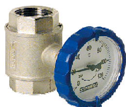
Kugelhahn PN 16 M für horizontalen und vertikalen Einbau mit rundem Thermometergriff blau, integriertem Thermometer Ø 63 mm