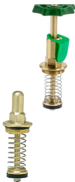
Fettkammeroberteil DIN-DVGW mit steigender Spindel, für absperzbare Rückflussverhinderer (KFR)