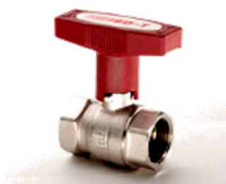
ISO-T-Kugelhahn mit verlängertem T-Griff rot, voll isolierbar Nr. 1458