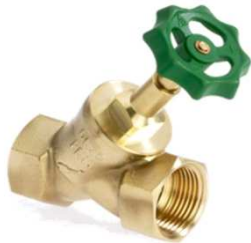
Freistromventil DIN 3502 mit Innengewinde und steigendem Oberteil DIN DVGW zertifiziert