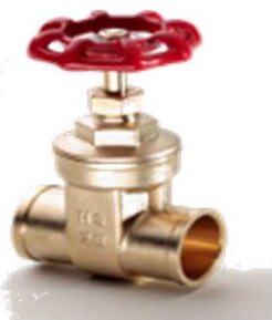
Nr. 1472 Absperrschieber aus Pressmessing PN 16 für Kupferrohr