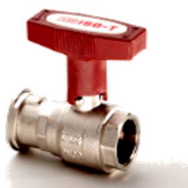
ISO-T-Pumpenkugelhahn mit verlängertem T-Griff rot, voll isolierbar PN 20, 120° Nr. 1478