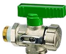
KFE-Kugelhahn PN 16 mit Flügelgriff DVGW-zertifiziert. Einschraubnippel aus entzinkungsbeständigem Messing. Ohne Schlauchverschraubung