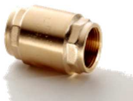
Euro-Rückschlagventil Gehäuse aus Messing bis 2" PN 25 in jeder Lage einbaufähig Nr. 1000