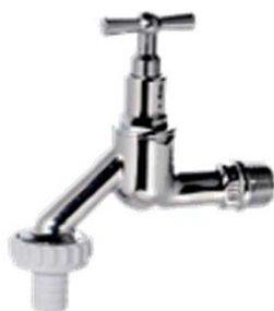
Auslaufventil mit Steckschlüsseloberteil matt verchromt mit Schlauchverschraubung mit Steckschlüssel Nr. 2158