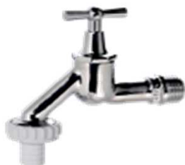
Auslaufventil mit Schlauchverschraubung mit stopfbuchslosem Oberteil matt verchromt Nr. 2150 poliert verchromt Nr. 2151